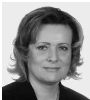
Alena Vitásková předsedkyně Energetického regulačního úřadu

Obnovitelné zdroje energie (OZE) jsou přírodní energetické zdroje, které mají schopnost částečné nebo úplné obnovy. U nás mezi ně řadíme energii sluneční, větrnou, geotermální, vodní, dále pak biologicky rozložitelný odpad, biomasu, bioplyn, skládkový plyn a kalový plyn z čističek odpadních vod. Elektrická energie vyrobená přeměnou z obnovitelných zdrojů není v současné době konkurenceschopná elektrické energii vyrobené z konvenčních zdrojů. Z důvodu podpory rozvoje výroby elektřiny z obnovitelných zdrojů je tato elektřina podporována tak, aby se cenově vyrovnala tržní ceně elektřiny.