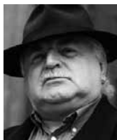
Milan Knížák autor je výtvarník

České vysoké školství nemá šanci na zlepšení, poněvadž v něm nevládnou racionální principy. Vždycky jsem si myslel, že zásadním úkolem vysokých škol je kvalitní výuka. To už ale neplatí. I když se na nejrůznějších fórech objevují dosud zakázané pojmy jako elitnost a excellence, skutečnost je zcela odlišná. Jedním z hlavních problémů je počet vysokých škol.