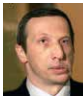
Václav Klaus ml.

Nechci fušovat z hlediska migrantů do řemesla ani „xenofobům, populistům a fašistům“ (to jsou ti, co mají obavy, či si kladou nějaké otázky), ani „sluníčkářům, vědcům a moderním politikům“ (to jsou ti, co jsou v pohodě a žádné otázky si nekladou).