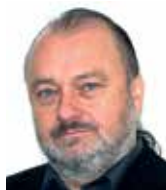
Ladislav Jaki Institut Václava Klause

Krise eura, vzniklá kolem Řecka, žádného vnímavého pozorovatele překvapit nemohla. V plné nahotě a s jistou neodvratností demonstrovala, že EMU není ideální měnovou zónou, že její heterogenita je přílišná, aby se to neprojevovalo při prvním větším ekonomickém otřesu, a že politické nástroje, které by zabezpečily hladké finanční transfery, nebyly při vši míře unifikovanosti a spoutanosti EU na tento problém předem připraveny a musejí se tvořit až nyní za pochodu, což je vlastní bezprostřední příčinou bruselské nemoci zvané Řecko.