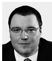
Miroslav Singer viceguvernér České národní banky