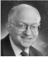
Martin Feldstein profesor ekonomie Harvardovy univerzity

Řecko nebude splácet svůj státní dluh. Toto nesplácení bude z velké části způsobeno jeho členstvím v Evropské měnové unii. Pokud by nepatřilo do měnového systému eura, Řecko by se možná nedostalo do současné svízelné situace, a i kdyby se do ní dostalo, mohlo by se vyhnout státnímu bankrotu.