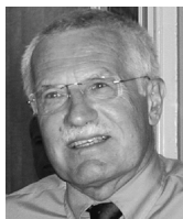
Václav Klaus, prezident republiky

1. Evropa – nebo snad přesněji Evropská unie – je nyní pro většinu z nás hlavním předmětem našeho zájmu. Je tomu tak proto, že EU stále více ovlivňuje a určuje naše životy, že stále více utváří základní institucionální rámec našeho bytí, že nás nutí stále více a více sledovat, co se děje v Bruselu a že nás nutí zbavovat se našich starých loajalit a přijímat loajality nové. To je – alespoň pro nás v nových členských zemích – radikálně nová situace a tato skutečnost by neměla být podceňována.