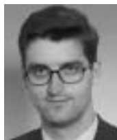
Hynek Fajmon Autor je poslancem Parlamentu ČR

Summit NATO se poprvé konal za bývalou železnou oponou v hlavním městě České republiky v Praze. Vzhledem k významu této akce je třeba věnovat velkou pozornost obsahu a výsledkům tohoto jednání.