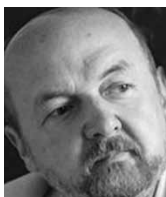
Ryszard Legutko profesor Krakovské univerzity a poslanec Evropského parlamentu

Nově zvolený šéf Evropského parlamentu ve svém inauguračním vystoupení připomněl otrěpanou metaforu, která už léta v evropském prostředí koluje a podle které integrace připomíná jízdu na kole: přestane-li cyklista šlapat, spadne – přestane-li se Evropa integrovat, rozpadne se. Není to příliš moudrá metafora: jakou hodnotu by měly instituce, jež by bylo třeba neustále měnit, neboť jinak by podlehly dezintegraci? Velmi dobře však vystihuje myšlení mnoha lidí. Jak se tedy věci mají? Dospěli jsme už ke konci a EU po politických hrátkách s euroústavou či Lisabonskou smlouvou už o ničem dalším nebude chtít slyšet, nebo se spustí zahřívací kolo dalších sjednocujících reforem?