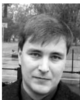
Lukáš Petřík autor je politolog

Poslední kniha europoslance Hynka Fajmona má ambici zmapovat nejfrekventovanější pojmy využívané evropskou levicí od diskriminace, globálního oteplování po trvale udržitelný rozvoj. Jak správně poznamenal Václav Klaus, jedná se o jakýsi typ orwellovského newspeaku či nyní konkrétně eurospeaku. Publikace se dotýká velké části problémů současné civilizace, ke kterým by měl člověk s pravicovým názorem zaujmout jasné stanovisko. Kniha je jakousi příručkou pravicového smýšlení. Autor správně připomíná, že politika je charakterizována střetem myšlenek. To již ostatně říkal známý jižanský konzervativce Richard Weaver, že ideje mají své konsekvence.