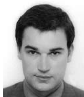
Mojmír Hampl viceguverner ČNB

Na následujících řádcích se chci věnovat myšlence, která není zcela nová, ale je nepochybně menšinová a málo zdůrazňovaná. Je až zarážející, jak málo je zdůrazňována vzhledem k tomu, na jak robustních empirických základech stojí.