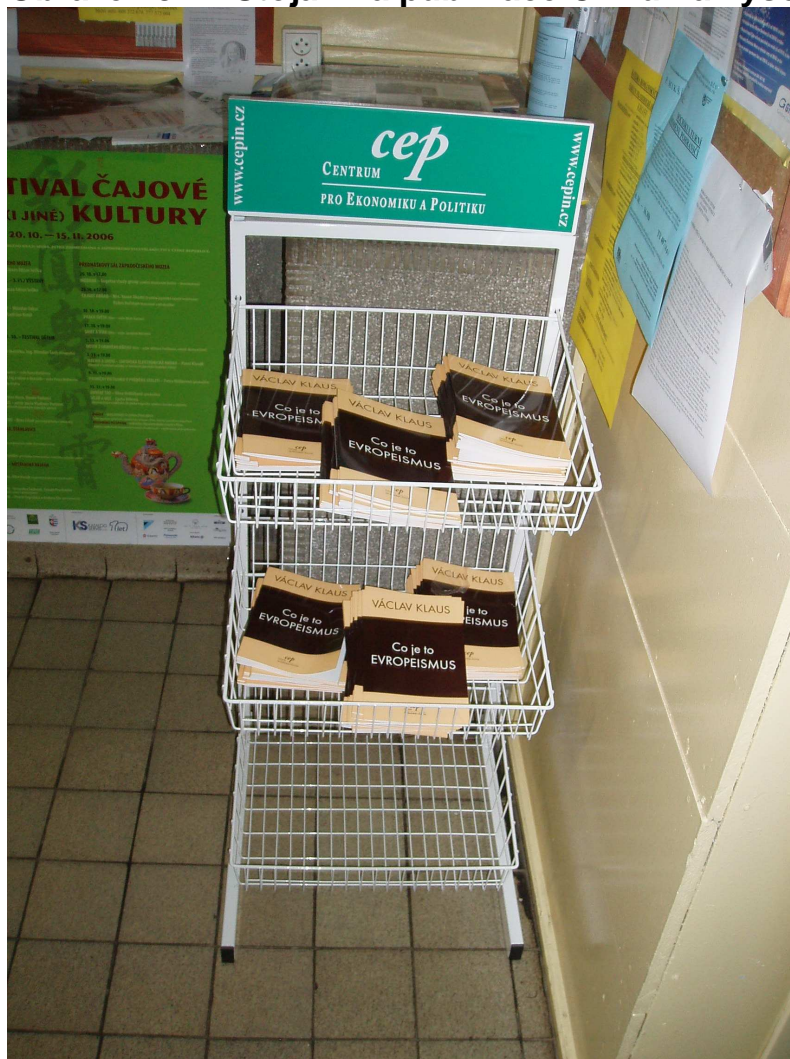
Obrázek č. 1: Stojan na publikace CEPu na vysoké školy

Ke konci roku 2006 CEP zvýšil náklad newsletteru z 2500 na 8000 a získal povolení od 12 fakult vysokých škol k umístění stojanu určeného k bezplatné distribuci newsletteru mezi studenty (viz obrázek č. 1). Ke konci roku měl CEP umístěno 10 stojanů (2 v Praze, 3 v Brně, 2 v Plzni, 1 v Ostravě, 1 ve Zlíně, 1 v Hradci Králové).